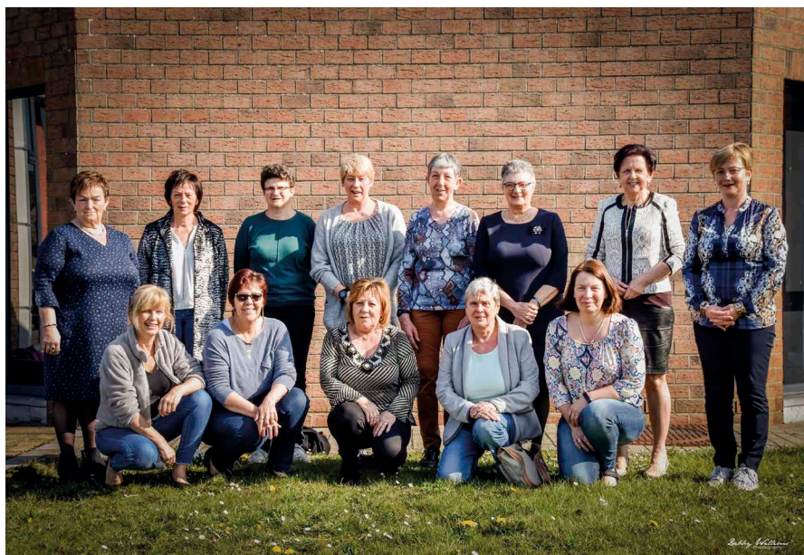
Deze Bekkevoortse dames ondersteunen de oproep om deel te nemen aan het bevolkingsonderzoek screening borstkanker